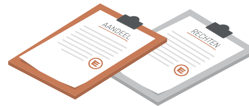
Aandeel en Recht...