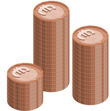
...eigen vermogen na claimemissie